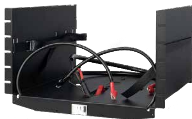
Battery shelf 24V L