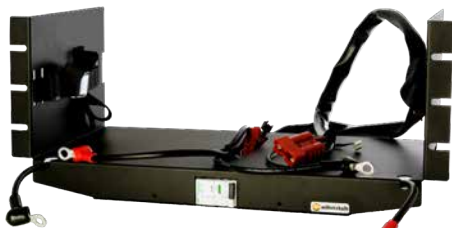
Battery shelf 24V M